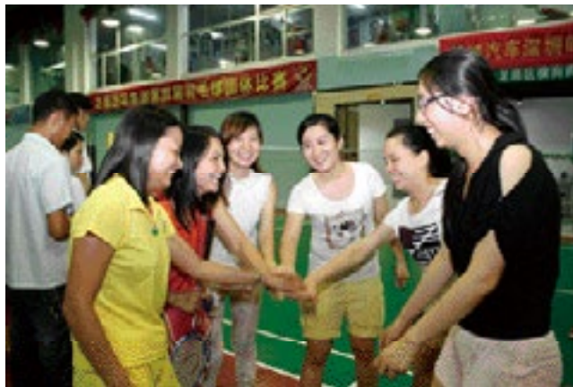
女队员们绽放着如花般的笑容相互鼓励加油