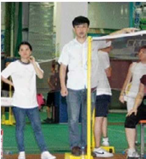
我们的“裁判哥”很有范儿