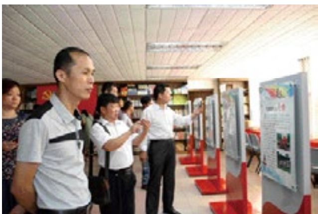
图为横岗街道“两新”党工委组织党员同志在我司党群活动室参观“红色印刷足迹”展

印刷术是中国古代四大发明之一。我们力嘉人从事的是具有中华民族悠久文明历史的行业、是现代高新技术引领包装印刷与时俱进的行业，我们为从事包装印刷工作而倍感光荣和自豪。我们在这里虚心地学习、努力地工作、幸福地生活；在这里磨练意志、享受人生成长的快乐。这里不一样的精彩，让我们流连忘返，让我们孜孜不倦地追求人生的美好梦想。