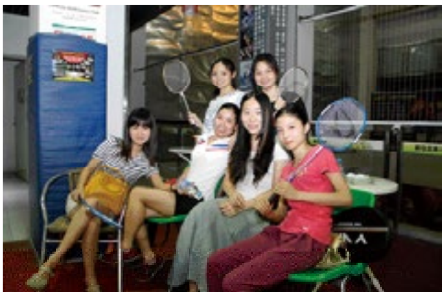
我们的美女队员和她们的“粉丝”在赛场休息时也不忘摆个POS，留住青春张扬、活力四射的美好瞬间