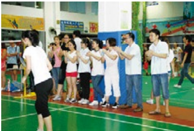
拉拉队整齐划一的鼓掌很吸引观众眼球噢