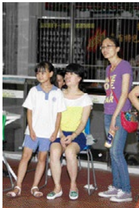
漂亮可爱的“学生妹”也赶来观赛助威