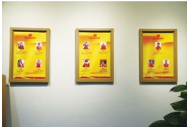
“园区志愿者先锋”宣传墙