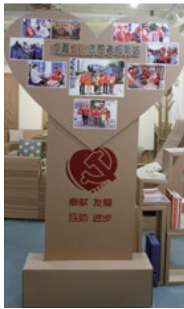
力嘉党员志愿者服务站“心形”宣传栏