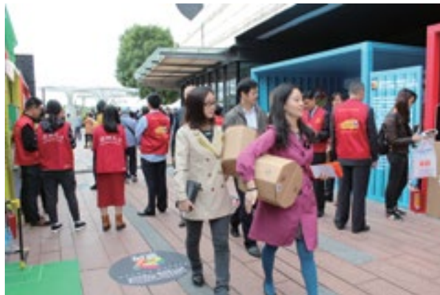
嘉宾把创意瓦楞纸座椅带回家