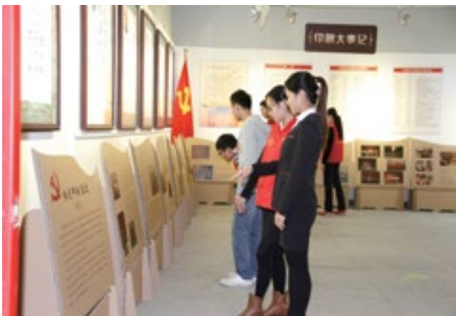
园区印刷博物馆新创建的“红色印刷足迹展”