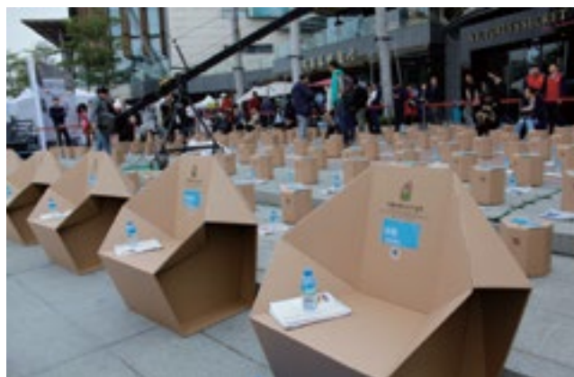
“创意十二月”开幕式现场 力嘉创意文化产业园提供的创意瓦楞纸座椅

木马、瓦楞纸桌子、创意台历等创意瓦楞纸产品，参加开幕式现场的“创意市集”活动，力嘉创意生活体验展区现场也是吸引了无数观众前来体验、询问，备受观众青睐。