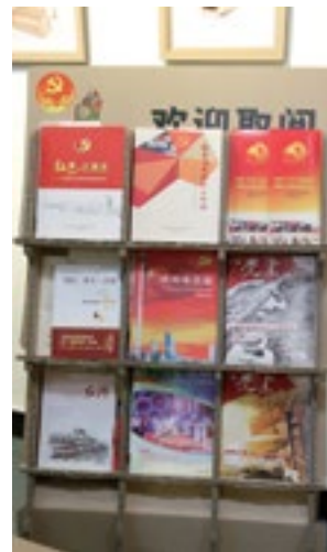
志愿园内放有党建资料的书架