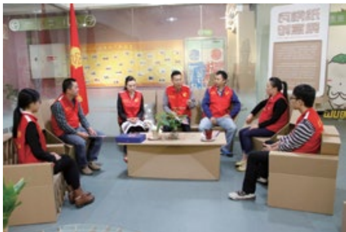
图为我司志愿者在“党员志愿者服务站”召开民主生活会