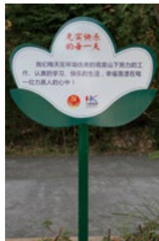
图文并茂的“树苗形”宣传栏