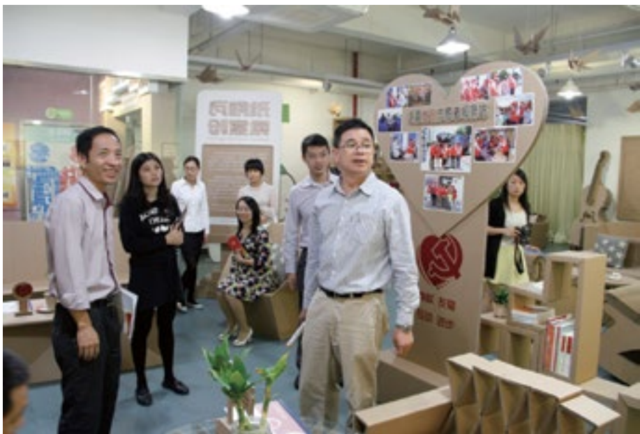
图为区、街道“两新”党组织领导在力嘉志愿园检查指导工作