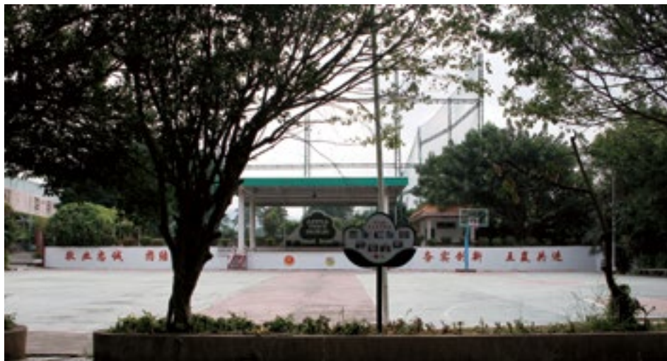
焕然一新的力嘉文化广场