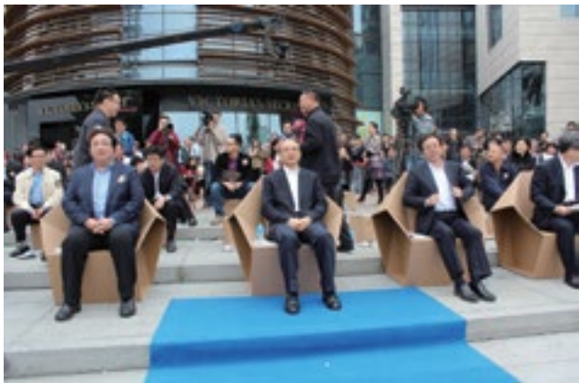
深圳市市长许勤（前排左二）等领导出席开幕式