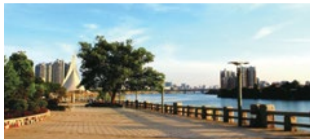
滨江湖畔 宜居怡人