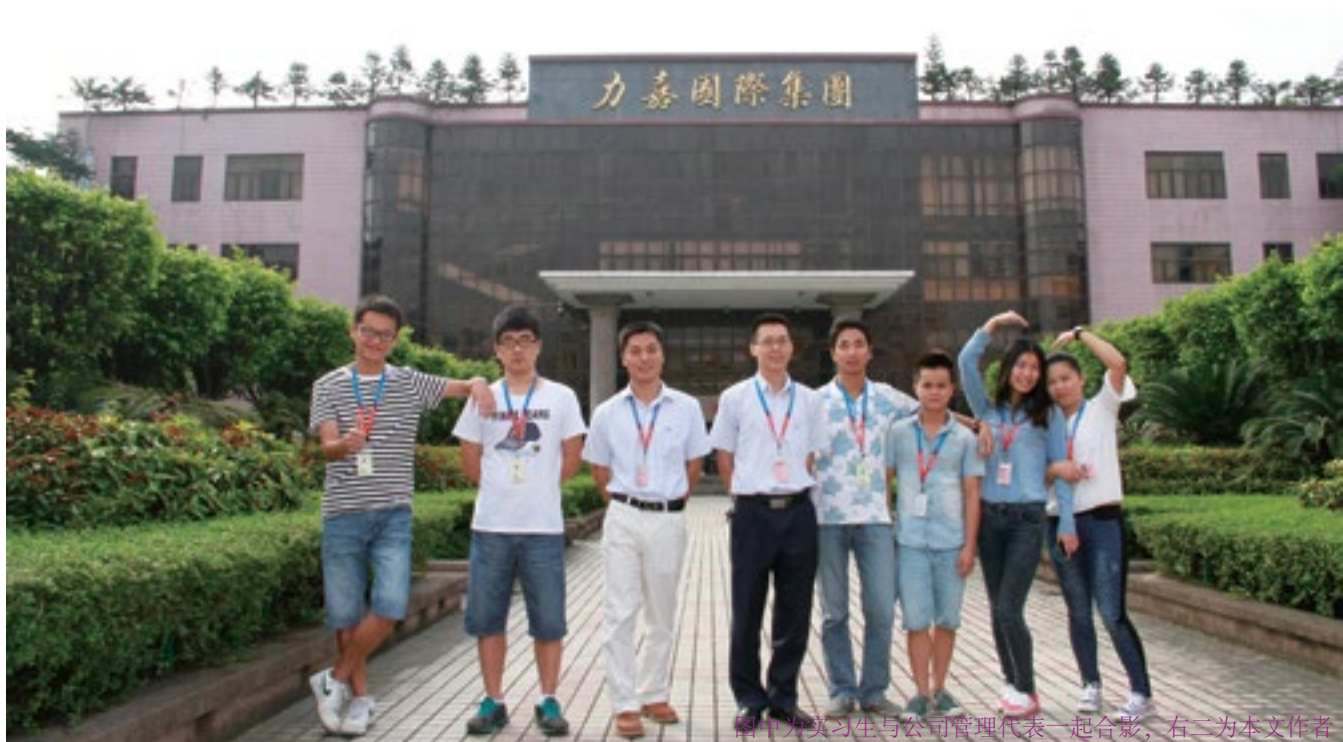
图中为实习生与公司管理代表一起合影，右二为本文作者

从9月1日到现在，我们这批来自湖南工业大学的实习生已经在力嘉实习一个多月了。刚进力嘉的我们，对实习生活带着小小向往的同时，感到自己的无知，对自己的未来亦深感迷茫。经过一个多月的学习与培训，从学生时代到办公人士的转型，让我体验到工作与学习、学校与职场、学生与职员的差距。尽管工作的环境和学校的环境相差甚大，但是让我们学到的也是在学校接触不到和体会不到的。