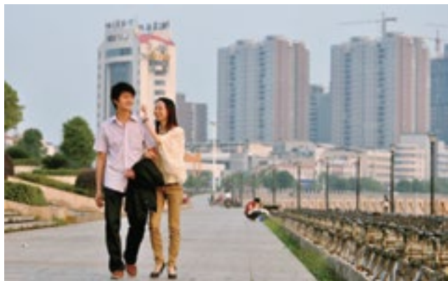
潇湘公园 恋人漫步